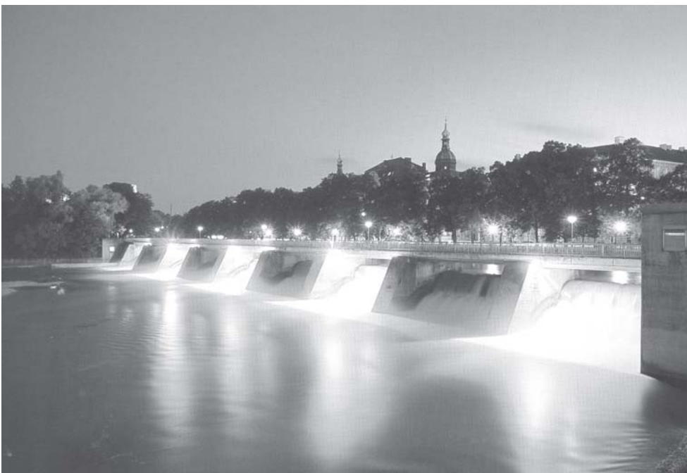
„München im Licht“, eine Installation von Joachim Fleischer zwischen Ludwigsbrücke und Praterinsel.

· Der Stadtrat hat im Rahmen der Kürzungen des städtischen Kulturhaushaltes 2003 beschlossen, zwei Bibliotheken zu schließen sowie weitere sechs Bibliotheken zu drei Mittelpunktsbibliotheken zusammenzulegen. Das Bücherbegehren gegen diese Maßnahmen ist mit ca. 80.000 Stimmen zwar knapp am Quorum von 90.000 Stimmen gescheitert, hat aber deutlich ge-