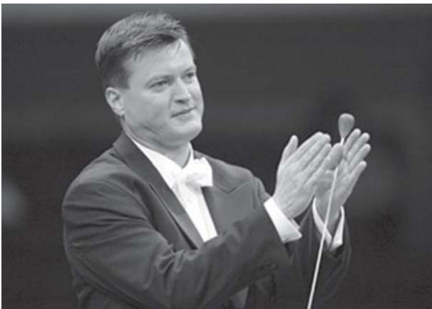
Neuer Chef der Philharmoniker: Christian Thielemann