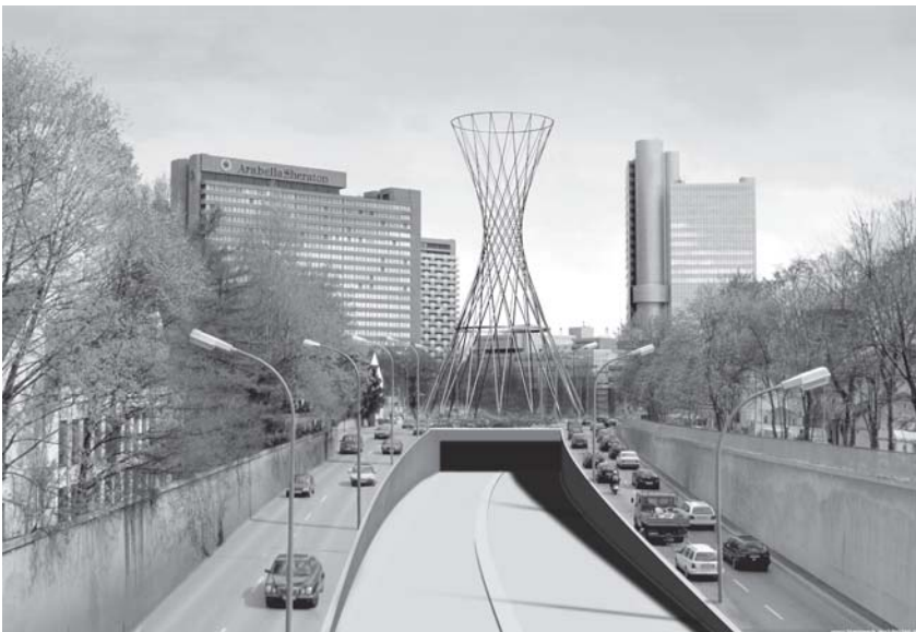
So soll „Mae West“ einmal den Effnerplatz überragen

(Eine Übersicht über die Projekte der „Kunst am Bau und im öffentlichen Raum und noch mehr Infos sind unter http://www.quivid.de zu finden.)