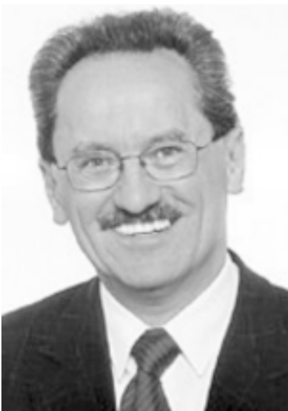
Das U-Bahn-Bauen liegt ihm im Blut...