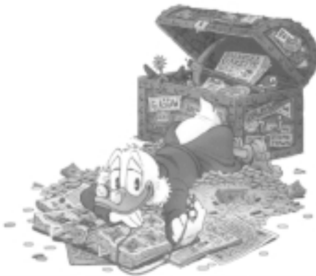
Damit Politik wieder Spaß macht...