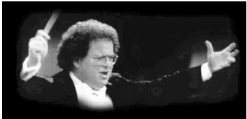
Große Meister kosten großes Geld. James Levine hat bei den Philharmonikern auch finanziell Maßstäbe gesetzt.

Selbst wenn sich der Stadtrat dazu durchringt, noch weitere Konsolidierungsleistungen aus den Bereichen der Kammerspiele und der Philharmoniker zu nehmen, wird dies nur in Maßen gehen und kann die Konsolidierung der Volkshochschule und der Stadtbibliotheken nicht übernehmen – außer man würde die Stellung der Philharmoniker oder der Kammerspiele als Aushängeschilder der Kulturstadt München antasten, eine Alternative, die sicherlich diskutiert werden muss.