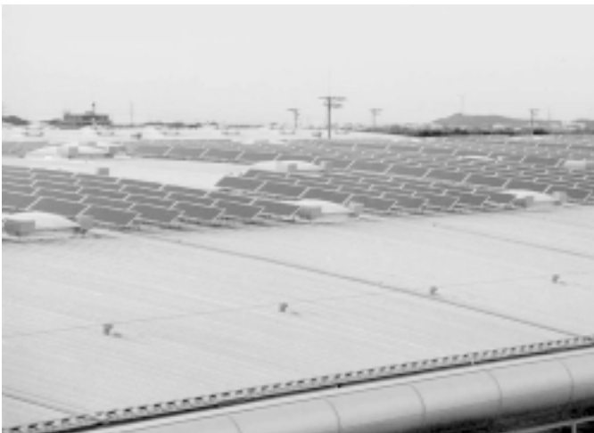
Auf immer immer mehr Dächern entstehen Solaranlagen