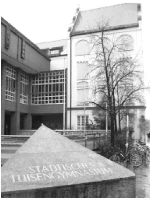
Wie lange kann die Stadt sich ihre Gymnasien noch leisten?

Doch die Finanzkrise der Stadt verlangt uns schwierige Entscheidungen ab. Hier lautet die Maxime: Qualität muss vor Quantität gehen. Das heißt: Die pädagogische Schulentwicklung, die Vernetzung mit Computern, der Einsatz neuer Unterrichtsformen wie der Medienpädagogik und natürlich auch die zahlreichen Fördermaßnahmen müssen erhalten und weiter entwickelt werden. Dafür wird man über weitere Reduzierungen der Eingangsklassen an BOS, FOS und Gymnasien, über die Übernahme von Schulen durch den Staat oder einen freien Träger und über die Schließung der Orientierungsstufe nachdenken müssen.