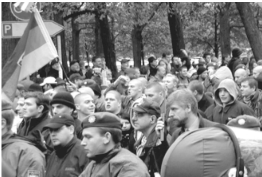
Nazis am 12. Oktober beim Verlassen der Theresienwiese

Am einfachsten wäre natürlich ein Verbot. Doch dies ist ein zweischneidiges Schwert: eine repressive Handhabung des Demonstrationsrechts kann sich leicht auch mal auf demokratisch gesinnte Demonstranten auswirken. Daher bleibt wohl nur das bekannte Mittel: Hingehen und protestieren, und zwar in so großer Zahl, dass der Polizei keine andere Wahl bleibt.